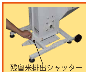
残留米排出シャッター