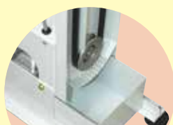
投入口 ヌカ取り機構