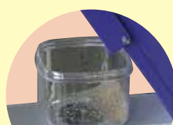
吐出口 ヌカ取り機構