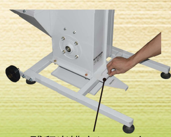
残留米排出シャッター