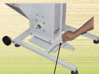
残留米排出シャッター