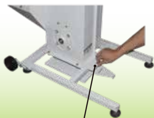
残留米排出シャッター