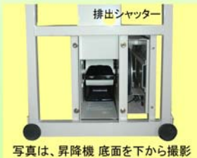
写真は、昇降機 底面を下から撮影

清掃時、昇降機 底部の 排出シャッターが全開するので残留米がきれいに排出されます